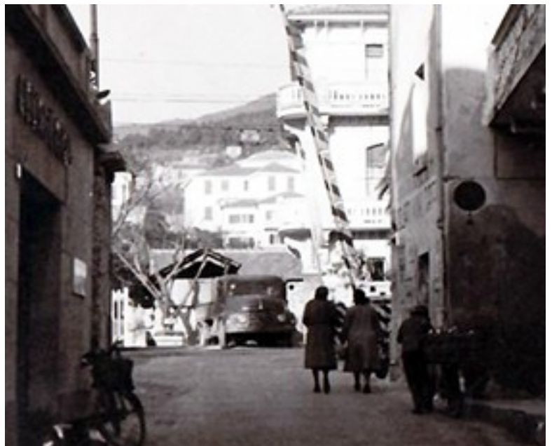
In primo piano via Manin con al centro la retrostante segheria affacciata su piazza “A Madunetta”.

Nel 1931 il Podestà di Spotorno intitolò la piazza, sino ad allora senza nome, al capitano marittimo Giuseppe Aonzo, savonese e medaglia d'oro della prima guerra mondiale; nel secondo dopoguerra, nell’ambito di una generale revisione della toponomastica cittadina, la piazza fu reintitolata ad Ambrogio Aonzo, medico e filantropo savonese. Tuttavia, nel gergo comune degli spotornesi, la piazza continuò a essere indicata come “A Madunetta”.