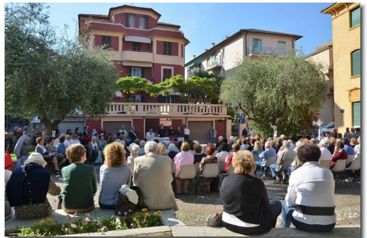
Domenica 10 Maggio 2015 il parroco di Spotorno celebra la prima S. Messa alla "A Madunetta"