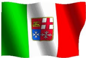
Carboniera “CARLO CANEPA”